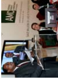
FINANCE ITALIA

2006 Les premières « obligations pour la vaccination » émises par l'IFFIm permettent de récolter 1 milliard d'US$. L'IFFIm a été créée en vue de mobiliser des fonds immédiatement disponibles pour les programmes de vaccination en exploitant les marchés des capitaux.